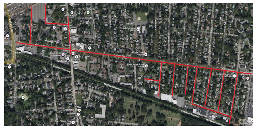
Mapa del proyecto, calles afectadas resaltadas en rojo (arriba)