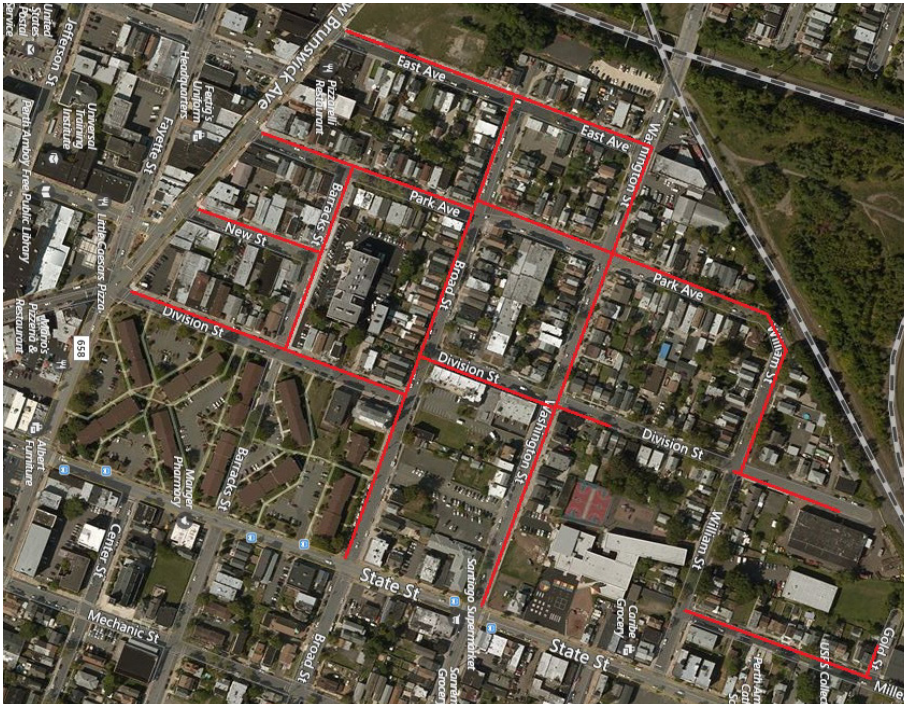
Mapa del proyecto, calles afectadas resaltadas en rojo (arriba)