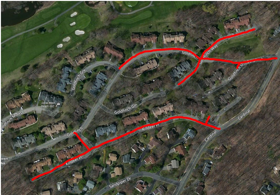
Project map, affected streets highlighted in red (above)