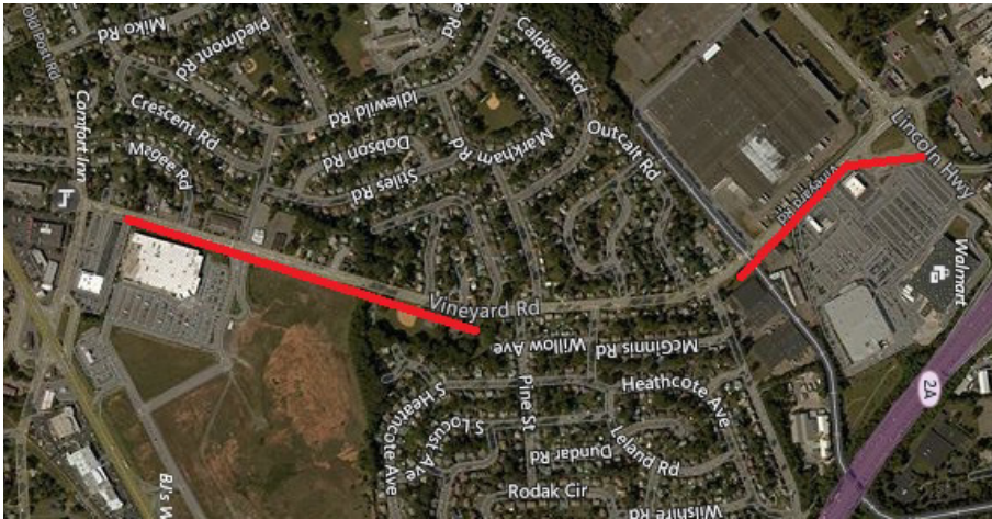
Mapa del proyecto, calles afectadas resaltadas en rojo (arriba)