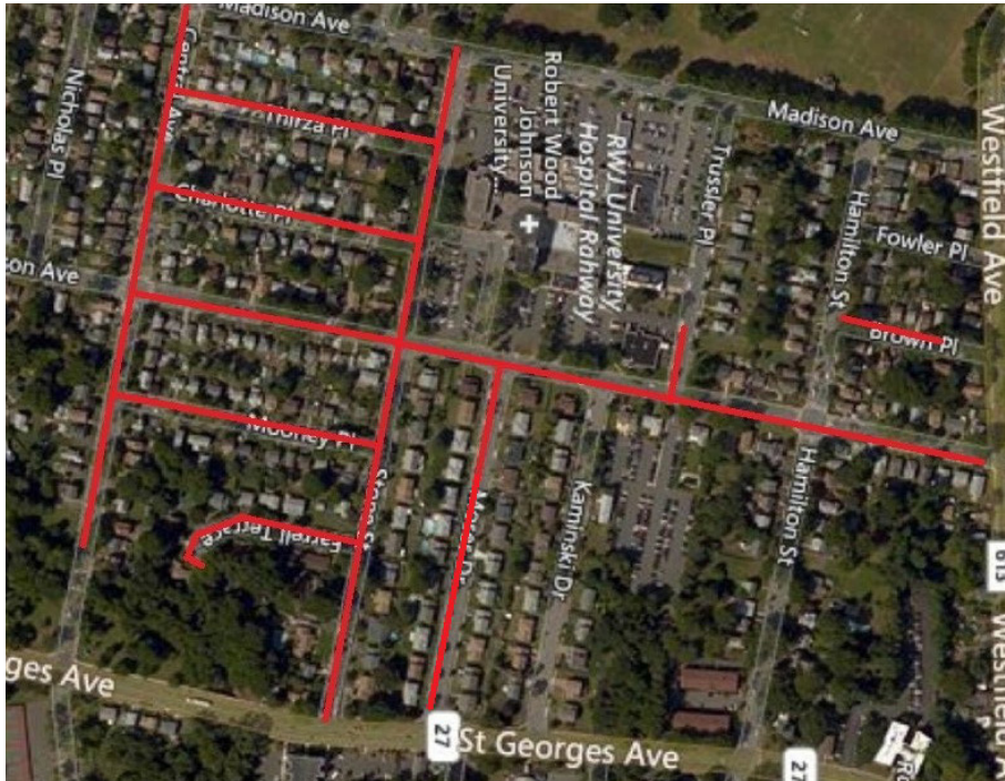
Project map, affected streets highlighted in pink (above)