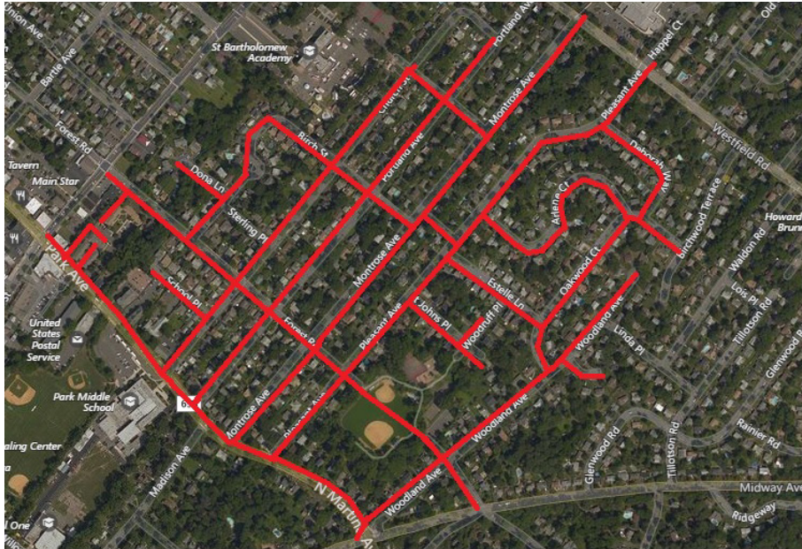
Project map, affected streets highlighted in red (above)