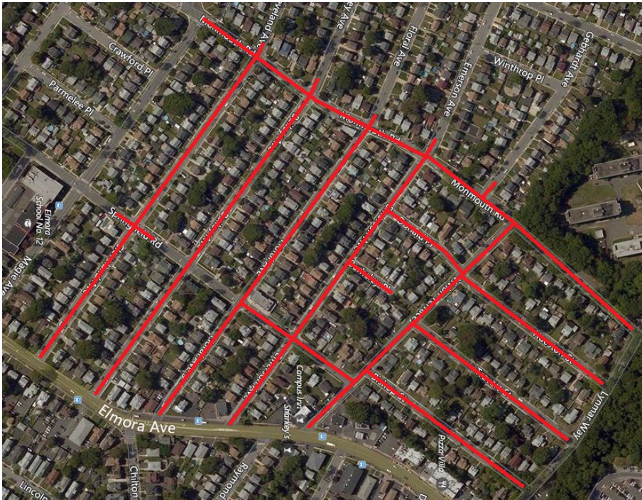
Project map, affected streets highlighted in red (above)