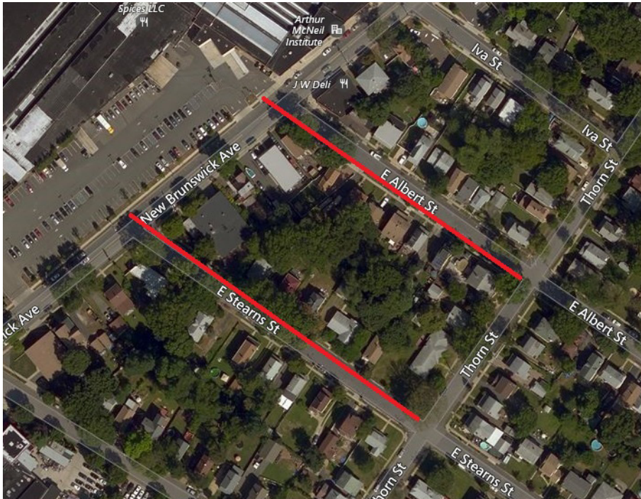
Mapa del proyecto, calles afectadas resaltadas en rojo (arriba)