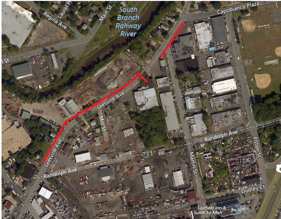
Project map, affected streets highlighted in red (above)