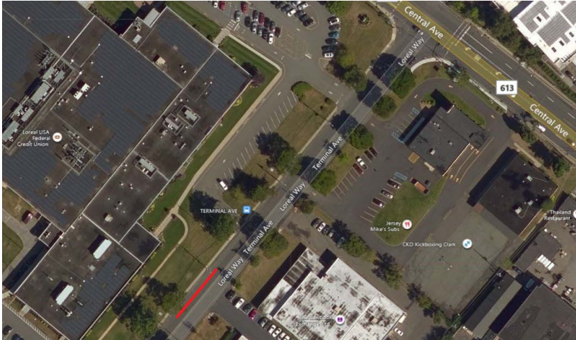
Mapa del proyecto, calles afectadas resaltadas en rojo (arriba)