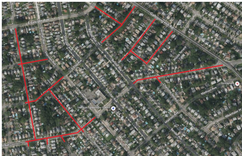
Mapa del proyecto, calles afectadas resaltadas en rojo (arriba)