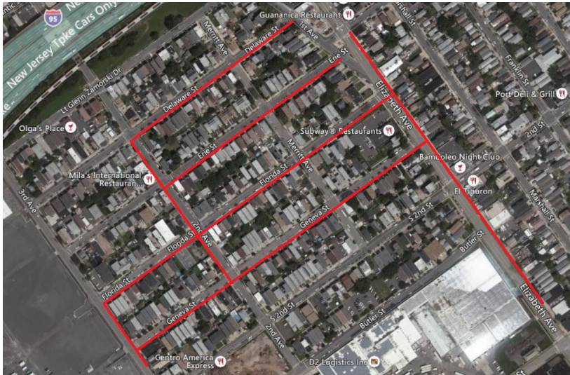
Mapa del proyecto, calles afectadas resaltadas en rojo (arriba)