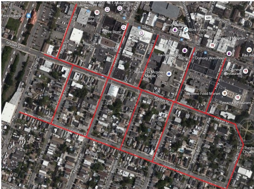
Project map, affected streets highlighted in red (above)