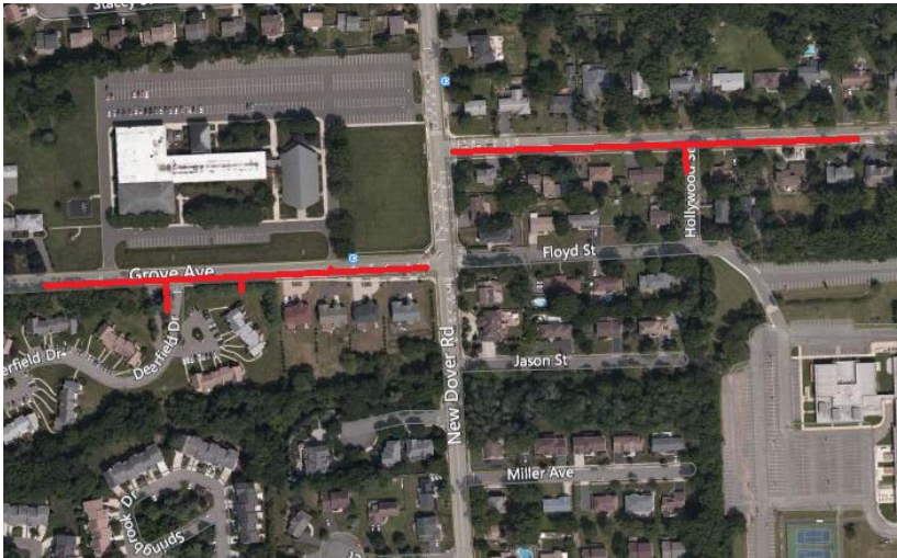
Mapa del proyecto, calles afectadas resaltadas en rojo (arriba)