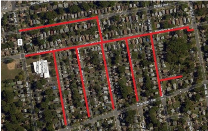
Project map, affected streets highlighted in red (above)