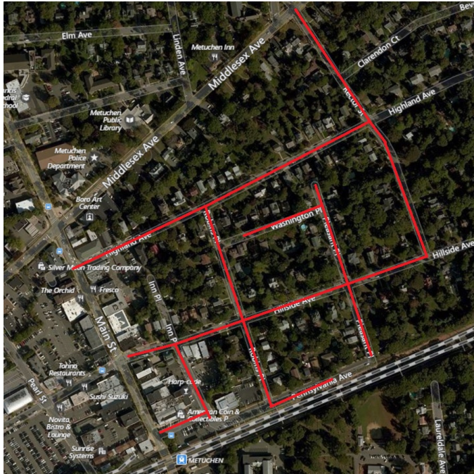
Project map, affected streets highlighted in red (above)