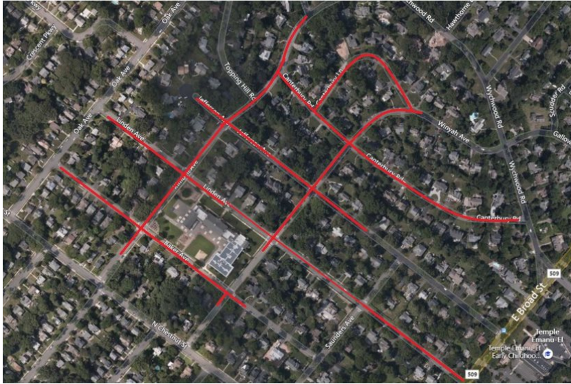
Mapa del proyecto, calles afectadas resaltadas en rojo (arriba)