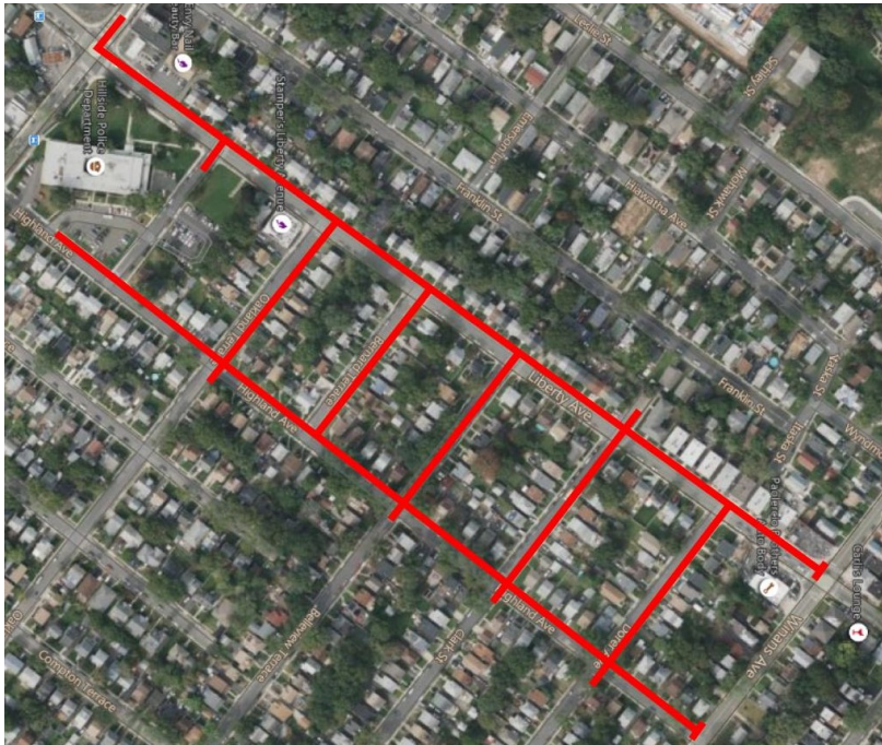
Mapa del proyecto, calles afectadas resaltadas en rojo (arriba)