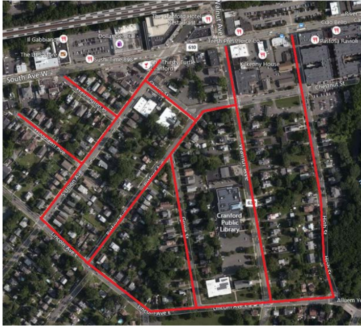
Project map, affected streets highlighted in red (above)