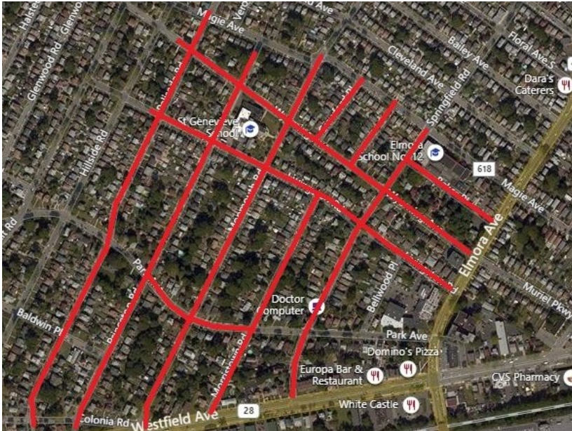
Project map, affected streets highlighted in red (above)