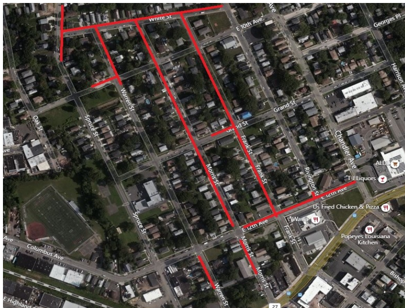
Project map, affected streets highlighted in red (above)