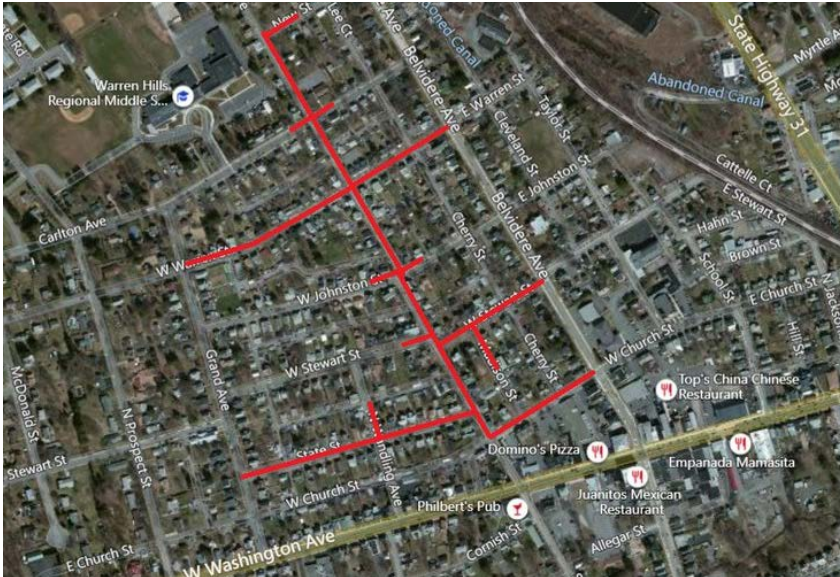
Mapa del proyecto, calles afectadas resaltadas en rojo (arriba)