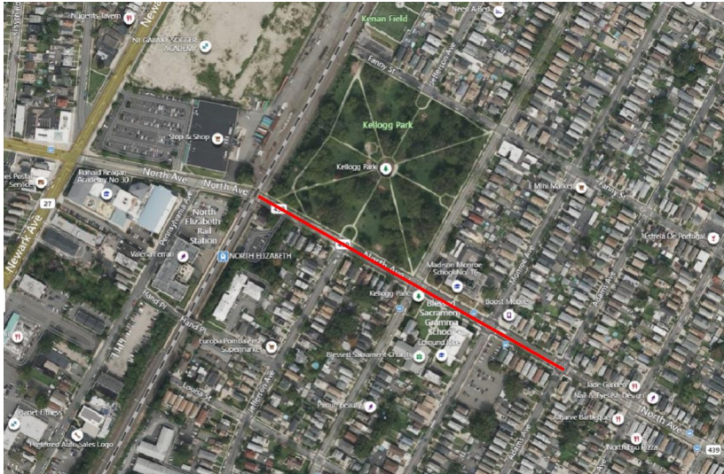
Mapa del proyecto, calles afectadas resaltadas en rojo (arriba)