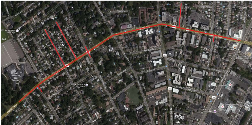
Mapa del proyecto, calles afectadas resaltadas en rojo (arriba)