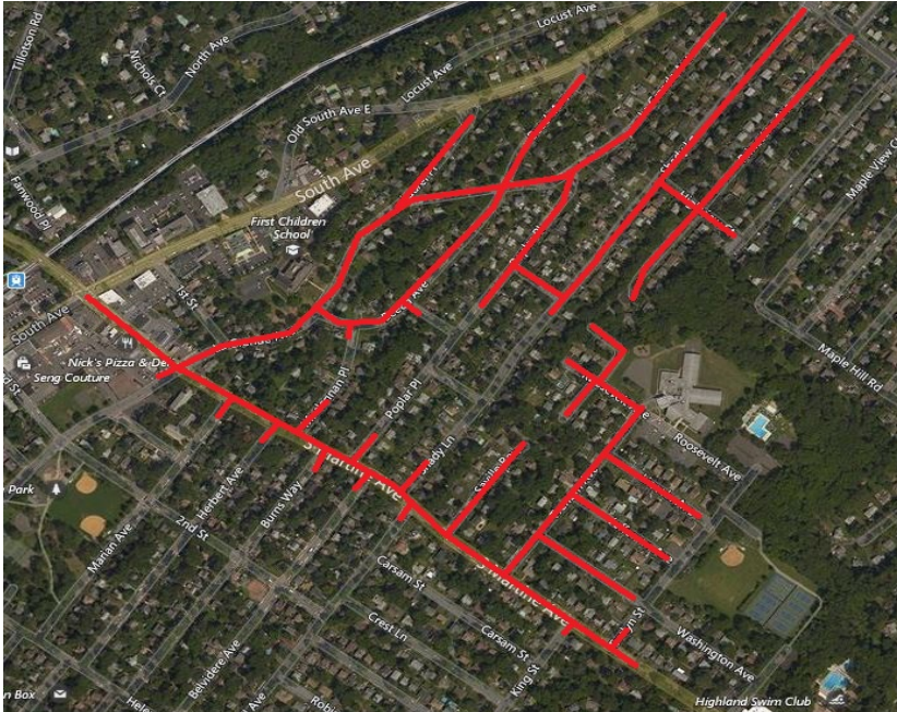
Mapa del proyecto, calles afectadas resaltadas en rojo (arriba)