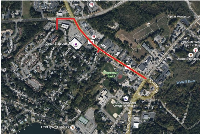
Project map, affected streets highlighted in red (above)