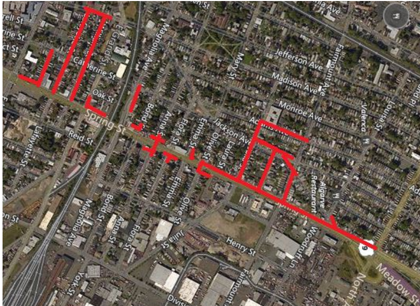
Mapa del proyecto, calles afectadas resaltadas en rojo (arriba)