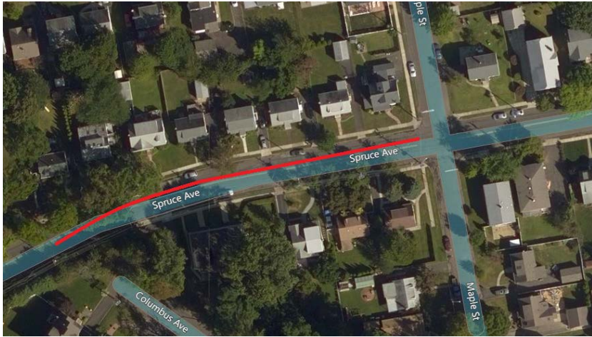
Mapa del proyecto, calles afectadas resaltadas en rojo (arriba)