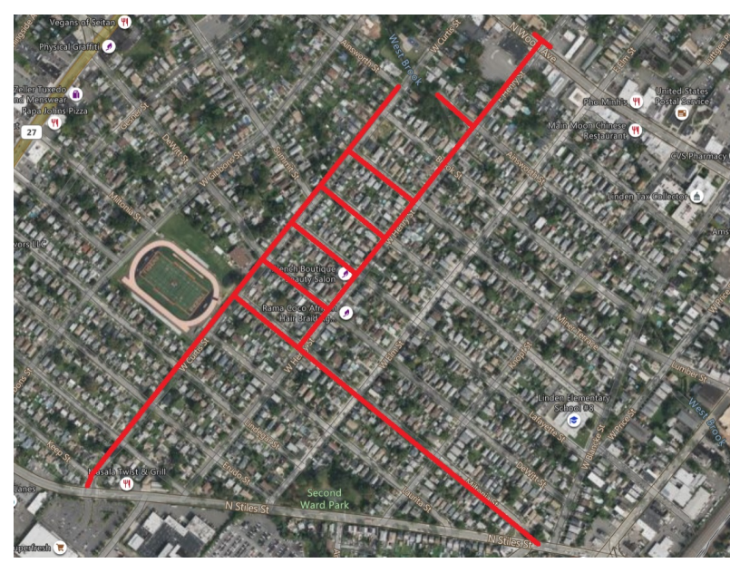
Mapa del proyecto, calles afectadas resaltadas en rojo (arriba)