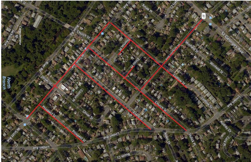
Project map, affected streets highlighted in red (above)