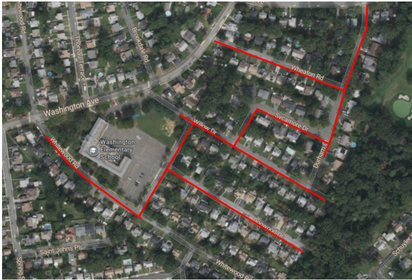
Mapa del proyecto, calles afectadas resaltadas en rojo (arriba)